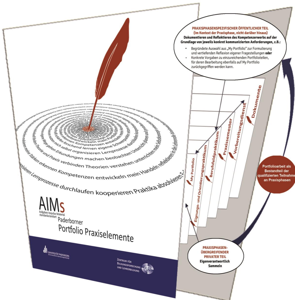
Abb. 1: Die Bereiche in AIMS

Die Pflicht der Offenlegung dieser Elemente bezieht sich lediglich auf den Kontext der jeweiligen Praxisphase, für die die Leistungen zu erbringen sind.